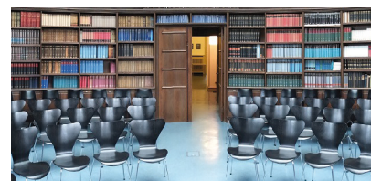
Lesesaal im Warburg-Haus Hamburg

Infos zur Hamburger Gastprofessur für Interkulturelle Poetik unter: