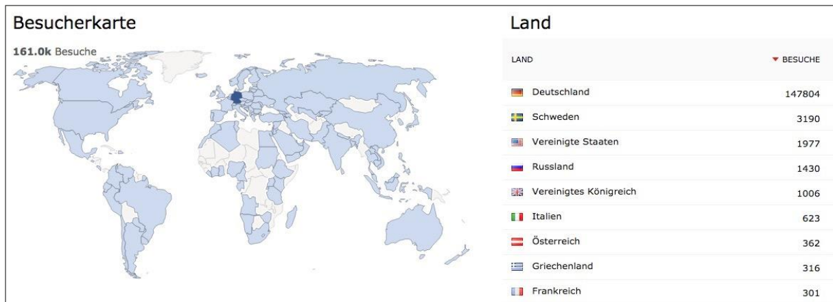
Abb. 5: Standorte der Hilfeportal-Besucher