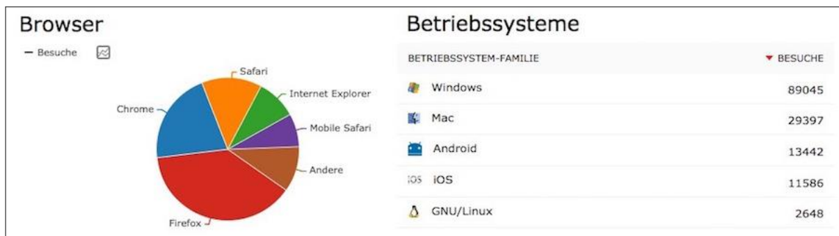
Abb. 3: Browser und Betriebssystemfamilien